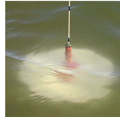
Måling af sigtdybde

Jeg har udarbejdet et tilsynsskema, hvor du systematisk kan gennemgå en række faktorer og give dem karakter fra 0 til 4. Der er seks grupper af faktorer, som skal vægtes ligeligt. Når alle grupper er gennemgået, tæller du karaktererne sammen. Summen giver søens kondital på en skala fra 0 til 24.