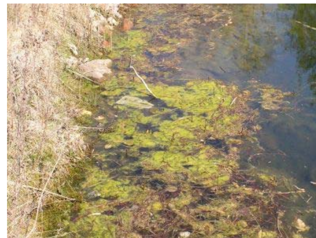
Trådalger vokser frem fra bredden, hvor næringsrigt vand fra affald siver ud i søen

har forbedret miljøtilstanden. Muddret er forsvundet fra bunden, og der lever nu krebs på fire meters dybde. Søens kondital: 19,3 - 20,8 = \text{god} .