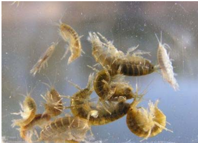
Ferskvandstanglopper er iltkrævende dyr – de er tegn på et iltholdigt vandmiljø

Kloakvand, ænder, drænvand og blade tilfører næringsstoffer. De er her nævnt i rækkefølge efter, hvor alvorlige de er. Ved gennemgang af søen skal du notere ned, hvilke næringskilder, der findes i søen.