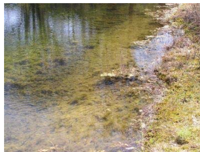
Den modsatte bred er fri for trådalger